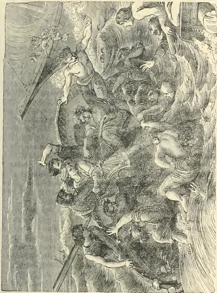
Naufrage de la Blanche-Nef .

hésitaient. Guillaume de Breteil, venant de la forêt Neuve, accourut, hors d'haleine, pour s'opposer à cette demande : « Toi et moi, » dit-il à Henri, nous devons nous souvenir loyalement de la foi